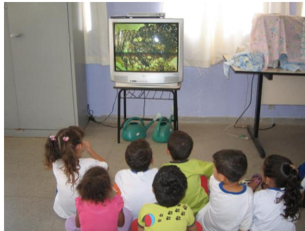
Figura 3 – Crianças assistindo aos vídeos sobre as abelhas.

Para verificar as hipóteses das crianças sobre o comportamento das abelhas, foram apresentado as crianças os filmes “As Abelhinhas” que mostra o funcionamento de uma colméia, e também o filme “As Abelhas: Um Inseto Social”, disponível na videoteca do CDCC, que apresenta o comportamento das abelhas (Figura 3)