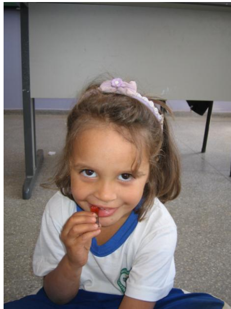
Figura 1- Criança experimentando o mel.

Levei sachês de mel e ofereci para as crianças para que elas experimentassem. (Figura1).