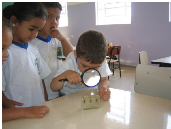
Figura 4 – Crianças observando as abelhas com lupa.

Após essa observação as crianças registraram por meio de desenhos, o que viram nos filmes apresentados e nas abelhas da resina (Figura 5).